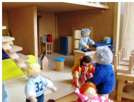
Spielgelegenheiten für Kinder zu diagnostischen und therapeutischen Zwecken

Die Familien-, Erziehungs- und Jugendberatung bietet psychologische Beratung für Eltern, Kinder, Jugendliche und junge Erwachsene in unterschiedlichen Settings an. Weitere Arbeitsfelder sind pädagogisch-therapeutische Gruppenangebote, Familientherapie, videogestützte Beratung, psychologische Diagnostik und Hilfeplanung, Beratung bei Trennung und Scheidung, Beschützter Umgang, Onlineberatung, präventive Angebote, Kooperation und Vernetzung.