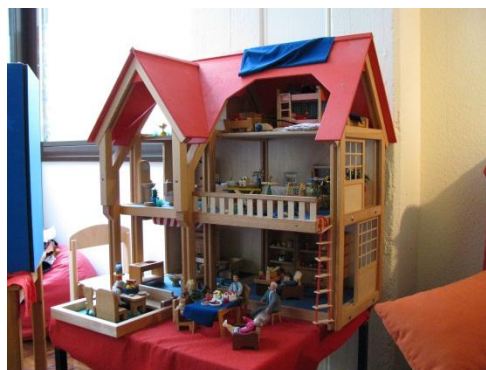
Puppenhaus im Kindertherapiezimmer

Dieses Verfahren ist ressourcenorientiert und stärkt vor allem die Bindungssicherheit der Kinder und Jugendlichen. Besonders Eltern aus Multiproblemfamilien sind über die Visualisierung und die überwiegend positive Konnotation ihres Verhaltens zu mehr Einfühlung in sich selbst und in ihr Kind fähig. Auch Kinder und Jugendliche können in einigen Fällen gut erkennen, dass sie die häufig misslingende Kommunikation mit ihren Eltern mit gestalten und positiv beeinflussen können.