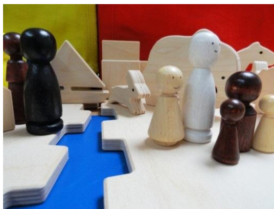
Kinder spielen „Trennung der Eltern“

Wie im Bericht der Erziehungsberatung bereits erwähnt: In Fortführung des 2008 begonnenen Projekts bietet die Paar- und Lebensberatung in Kooperation mit der Erziehungsberatung im hiesigen Zentrum „Konfliktregulierende Beratung“ an. Die KrB wendet sich an Eltern in einer Trennungssituation, deren Streitigkeiten und Auseinandersetzungen von einem hohen Eskalationsgrad gekennzeichnet sind. Es ist davon auszugehen, dass etwa 8 - 10 % der geschiedenen oder getrennten Eltern als hochstrittige bzw. hocheskalierte Fälle gelten, die von sich aus zu keiner konstruktiven Einigung im Hinblick auf den künftigen Umgang mit dem Kind gelangen. Inhaltlich geht es in der KrB vorrangig um Sorge- und/oder Umgangsrecht und in diesem