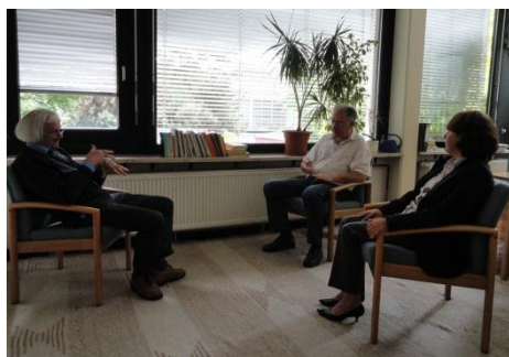
Beratungsgespräch mit einem Paar (Szene nachgestellt)

Eine Zahl sollte im Fokus unserer Aufmerksamkeit stehen: Die Anmeldung von Paaren und Einzelpersonen in fortgeschrittenem Lebensalter nimmt kontinuierlich zu, 47 % sind bis 45 Jahre, 53 % bis und über 65 Jahre alt. Insgesamt beträgt das Durchschnittsalter aller Ratsuchenden in diesem Beratungsfeld 47 Jahre bei annähernder Gleichverteilung zwischen den Geschlechtern. Angesichts der steigenden durchschnittlichen Lebenserwartung sowie einer stark verlängerten potenziellen „Paarbeziehungsdauer“ – noch nie in der Geschichte konnten ein Mann und eine Frau eine derart ausgedehnte Zeitspanne miteinander verbringen – verwundert dies nicht. Die Tatsache länger dauernder