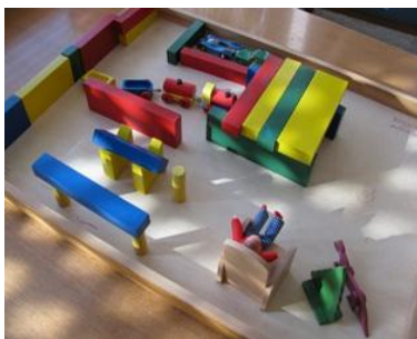
Spielszene im Sceno-Test

Neben der Onlineberatung gibt es seit 2010 die Möglichkeit geschützten Kontakt per Email mit der Erziehungs- und Paar- und Lebensberatung aufzunehmen: www.evangelischberatung.net/beratungszentrum-hoechst . Von dieser Möglichkeit, Rat und Information zu suchen, machten 2010 30 Ratsuchende Gebrauch.